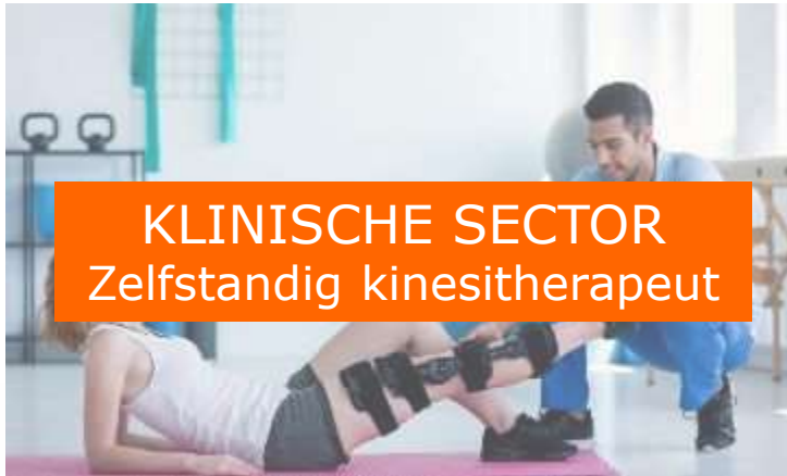
KLINISCHE SECTOR Zelfstandig kinesitherapeut