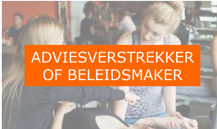
ADVIESVERSTREKKER OF BELEIDSMAKER