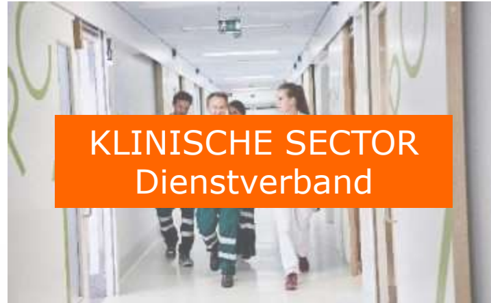
KLINISCHE SECTOR Dienstverband